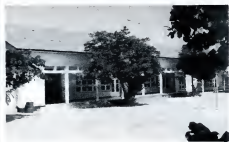
ABRAHAM DE VEERSCHOOL: openbare M.A.V.O.

Om enkele concrete punten aan te geven: begonnen moet worden met de oprichting van een planningsinstituut, dat door middel van research aan onderwijsvernieuwing en verbetering werkt, en dat uiteindelijk moet uitmonden in de creatie van een eigen aangepast onderwijsstelsel; verder een schooladviesdienst en een bureau voor leerplanontwikkeling, die allen bemand moeten worden door energieke, liefst ervaren, onderwijsdeskundigen. Inhoeverre het onder-